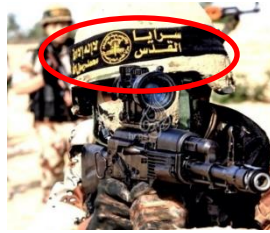
1.1.7 Iranische Revolutionsgarde